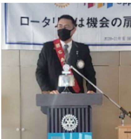
三須会員スピーチ