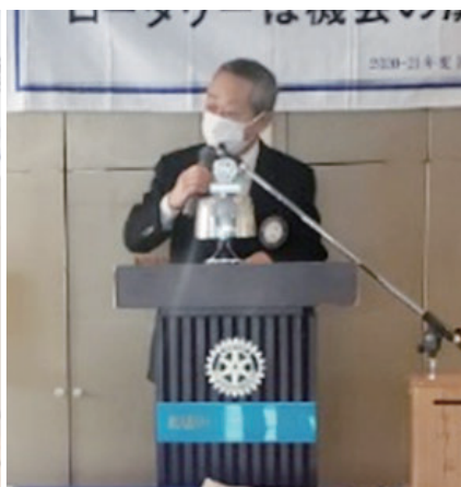
山口会員スピーチ